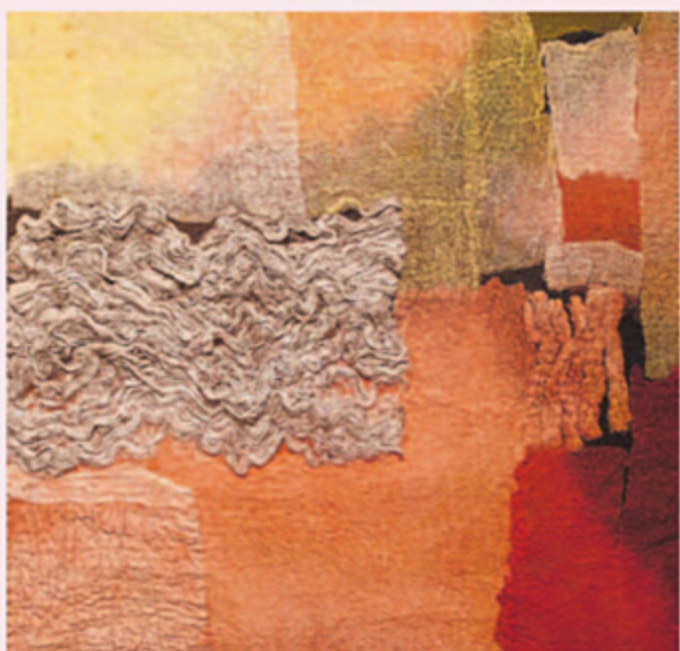
Truus Huijbregts, Nettle July.