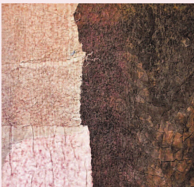
Truus Huijbregts, Simmer September.