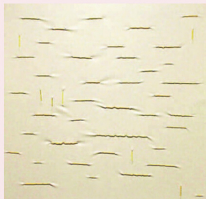
Janneke Hogerheijde, Geel op grijs.