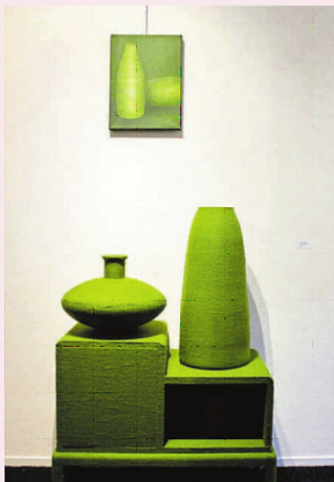
Jet van Oosten, Binnen is het groen.