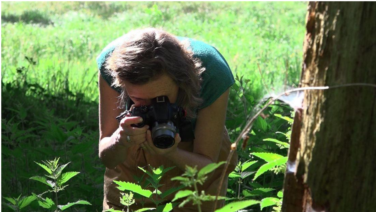
Marjorie Noë fotografeerde met infrarood

Meer dan tweehonderd kunstenaars wilden graag wat maken voor de expositie 'Geworteld' in Museum Westerwolde in Bellingwolde. Het geeft aan hoezeer bomen en bossen een inspiratiebron vormen. Dertig kunstenaars kregen een plek in de expositie.