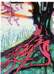
Arterieel, mixed media werk van Marian Hulshof

Mijn objecten zijn gemaakt van handgeschepte papier. Ik werk voornamelijk met moerbeipapier dat gemaakt wordt van de bast van de moerbeiboom, die na het regenseizoen wordt afgepeld. Daarna groeit de bast spontaan weer aan. Er is geen ingreep in de natuur nodig om dit papier te vervaardigen. Deze gedachte spreekt mij aan."